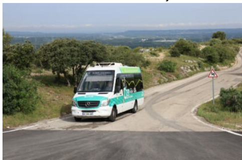
Bus Cmonbus (ligne E) arrivant à l'arrêt Saint Jacques à Cavaillon. Vue sur le panorama

Publié le 11/01/2024 – Mis à jour le 16/02/2024